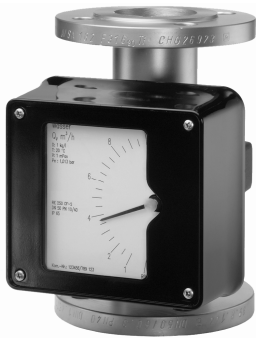
Bild 1 Mecon Schwebekörper-Durchflussmessgerät TM 250